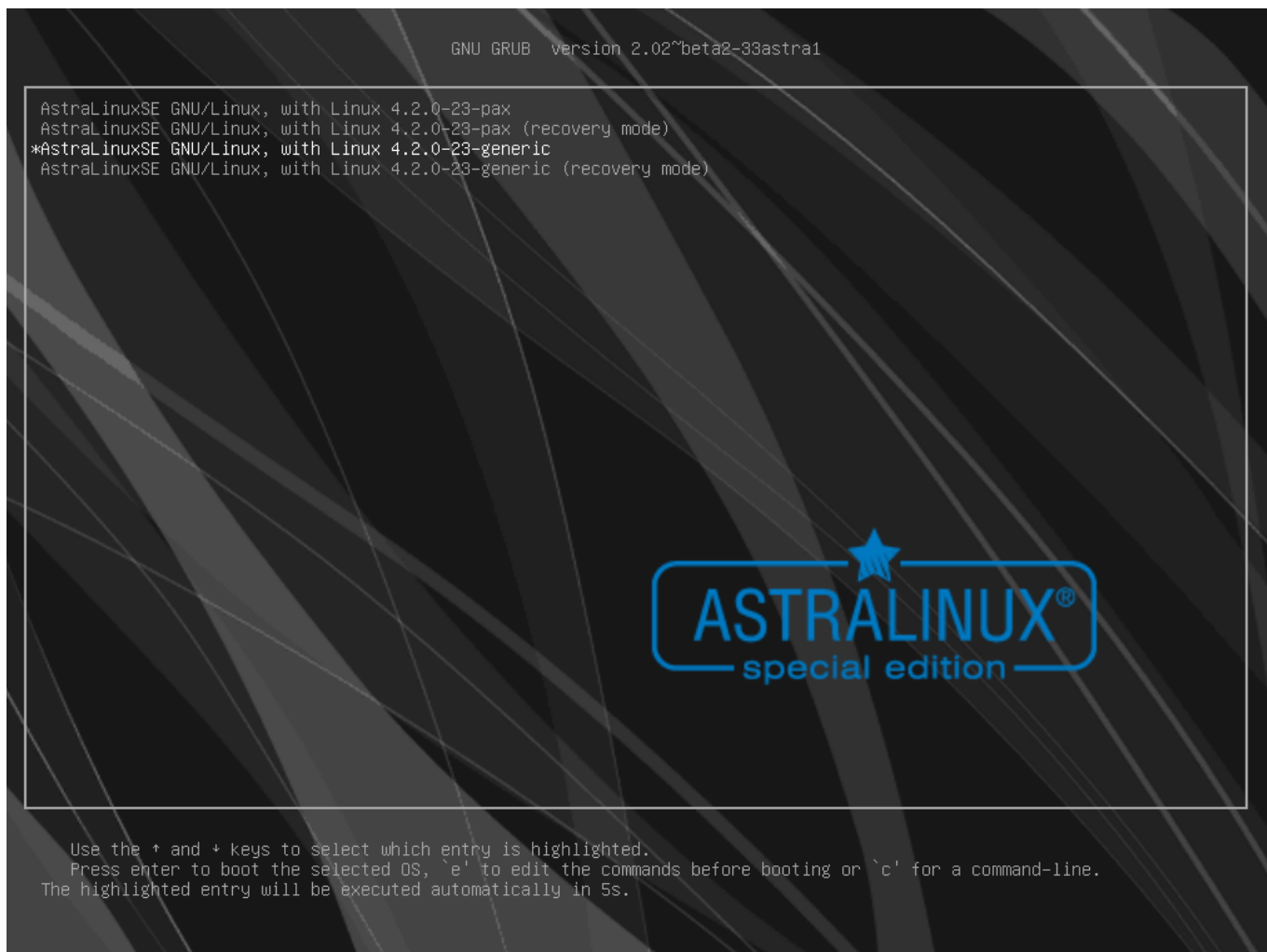
Рис. 1 – Окно запуска ОС

При запуске ОС появляется окно, вид которого представлен на рис. 1.